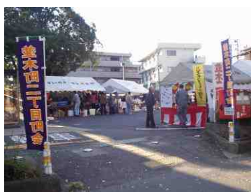
ふるさとまつり会場