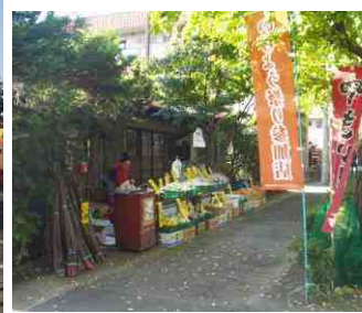
近隣住民の軒先で...