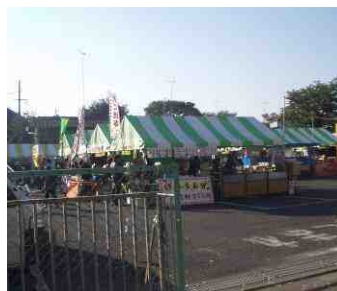
まちおこし広場会場