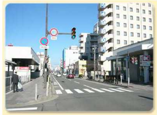
山形市メインストリート